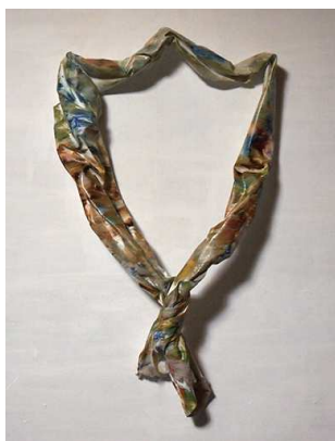
《factor x》2014 oil on canvas

1985年 愛知県生まれ。2008年 多摩美術大学美術学部絵画学科油画専攻 卒業。2010年 多摩美術大学大学院美術研究科絵画専攻油画研究領域 修了。| 個展 | 2013年「絵の背」float (東京) 2009年「メモ+部屋」ギャラリー東京ユマニテ (東京) | グループ展 | 2015年「アパートメント調布」調布会 (東京)、2014年「斜向かい」STUDIO HIRAMINE (東京)、2012年「woodland gallery 2012」みのかも文化の森敷地内野外 (岐阜) 2011年「アイムダイバー」KOSHIKI ART EXHIBITION 2011 (鹿児島)