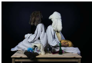
《Shining voices》2014 video, 6minutes