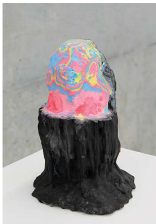
《make visible》2014 acrylic on plaster