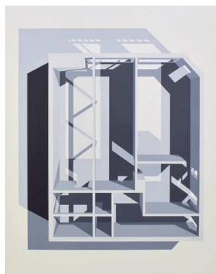
《Gallery》2015 oil on canvas