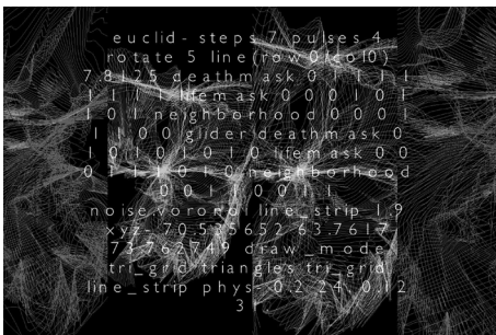
布山 陽介 / Yousuke FUYAMA http://yousukefuyama.com/

1980年大阪府生まれ。2003年東京造形大学造形学部美術学科絵画科卒業。2004年同大学版画コース研究生修了。近年の個展では2015年、「4つのために」kitoit(東京)。2014年、「PATTERN」gallery circle(東京)、「swimmer」sunday(東京)、「sinking of air」HARCOZA(東京) 木、絹糸、ビーズ、布、鏡、ガラス等の素材を用いたオブジェや、写真、シルクスクリーン、映像などを制作。それらをひとつの空間に配置し、微細な変化やささやかな関係性を生み出すインスタレーションを発表している。