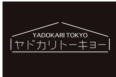
ヤドカリトーキョー http://valueraise.jp/yadokaritokyo

プログラミングによる作品創作や即興演奏を学び、音響、映像、グラフィック、インスタレーションなど多岐に渡る活動を展開し、主にインターフェースとプログラムを用いたデータの相互変換による表現を追求している。LAPTOPBATTLE TOKYO Vol.4 (2008) にて優勝し、その他 FUTURA、Sonic Art Project、ヨコハマ国際映像祭2009、DPG、soundfollies、SonarSoundTokyo2011、2012、EMAF TOKYO2013 やオランダ、ニュージーランド、韓国、台湾など、国内外の多数のイベントに参加しパフォーマンスやインスタレーション制作を行う。