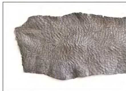
中井 伶美 超克に至る行為・ゆらぐ (2015, 薄美濃紙・ヘンプコード・インク・澱粉のり)