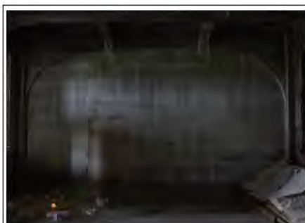
佐藤 琢巳 (2014, 和紙, 版画)