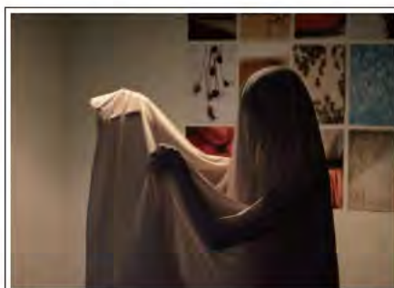
松縄 春香 Rhythmic Yellow Flower (2013, 椅子・布・机・食器・身体, パフォーマンス)

お問い合わせ：しばた みづき (東京芸術大学大学院油画研究領域博士課程2年) mizukishibata@me.com