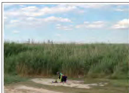
しばた みづき つぼなんかをつくる (2013~, 行く先々の土地, 実験)